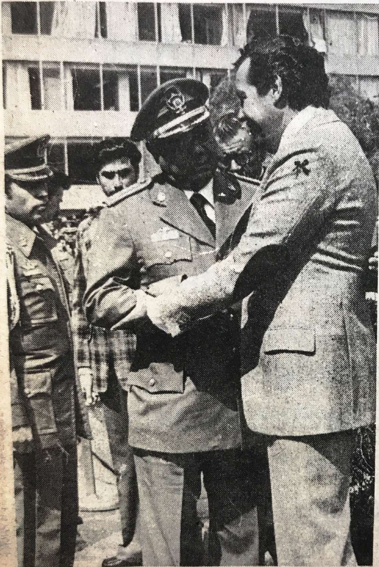
AVANCE. D.F. Oct. 22.- El jefe del Departamento del Distrito Federal Carlos Hank González felicita al general Durazo, director general de Policía y Tránsito del DF, por su labor, realizada en pro de la seguridad de la ciudad.